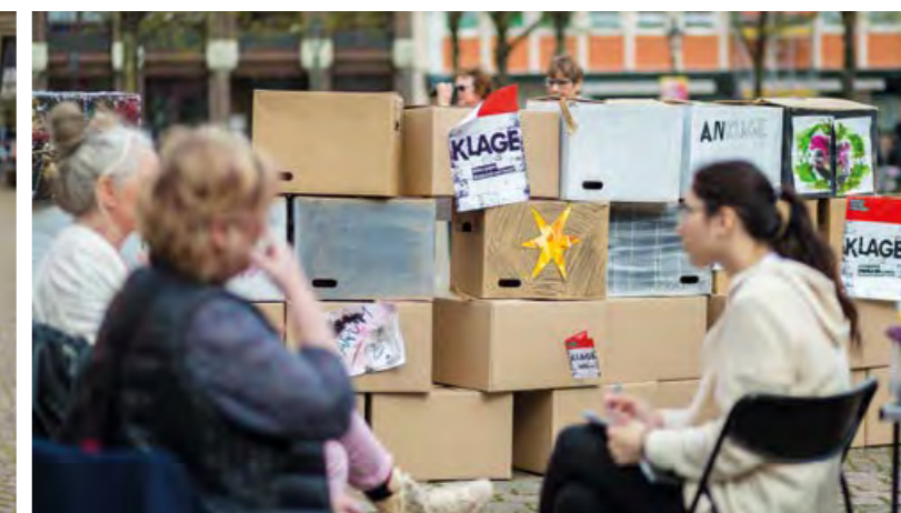
Aktion „Klagemauer“ der Kath. Citykirche auf dem Laurentiusplatz als freie Installation und Motivation zur Interaktion und zum Austausch.